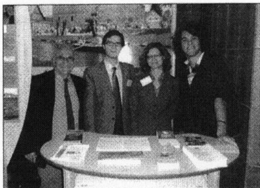
V Centru Bavaria Bohemia (CeBB) v Schönsee

oboru Evropská teritoriální studia tvoří předměty oborově značně různorodé. Jsou to disciplíny politologické, obecně kulturní a kulturologické, ekonomické, právnické a samozřejmě jazykové. V bakalářském stupni studia je to především němčina jako jazyk všeobecný a odborný, v připravovaném magisterském studiu to bude angličtina, příp. francouzština nebo španělština, zejména jako jazyk odborný. Náš ústav však má ještě řadu dalších zvláštností, ať už je to povinnost studentů absolvovat během studia dvou až tříměsíční pracovní stáž či semestrální studijní pobyt v některé z německy mluvících zemí, nebo odborná výuka probíhající pouze v němčině. Také bakalářské práce mohou psát studenti buď česky, nebo německy. Z toho je zřejmé, že jejich jazyková vybavenost musí být už na začátku studia dobrá. Dbáme na to ostatně už při přijímacích zkouškách, při nichž vyžadujeme doloženou znalost německého jazyka minimálně na úrovni A2 SEER.