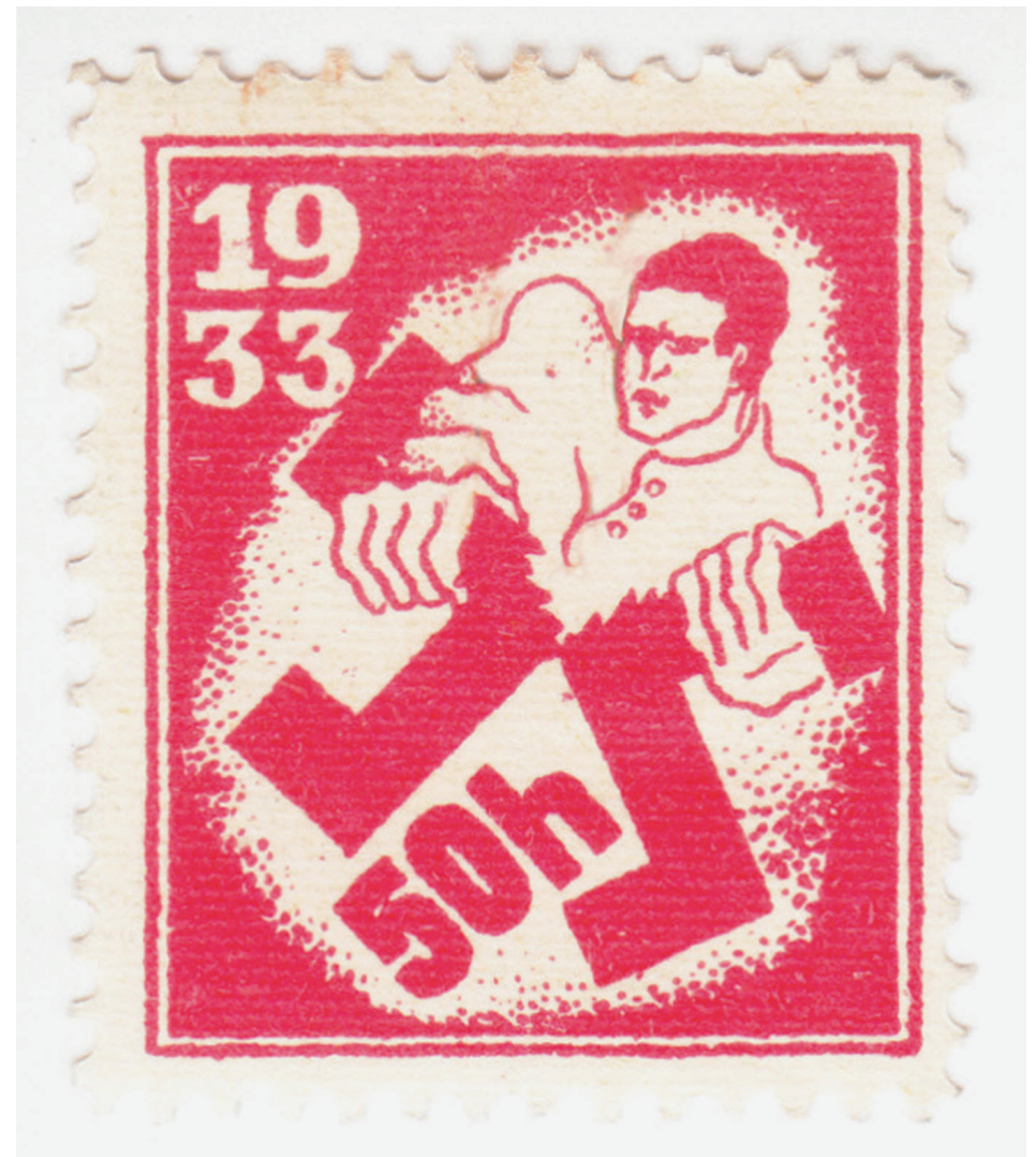
5) Národní archiv, Policejní ředitelství Praha II – prezidium